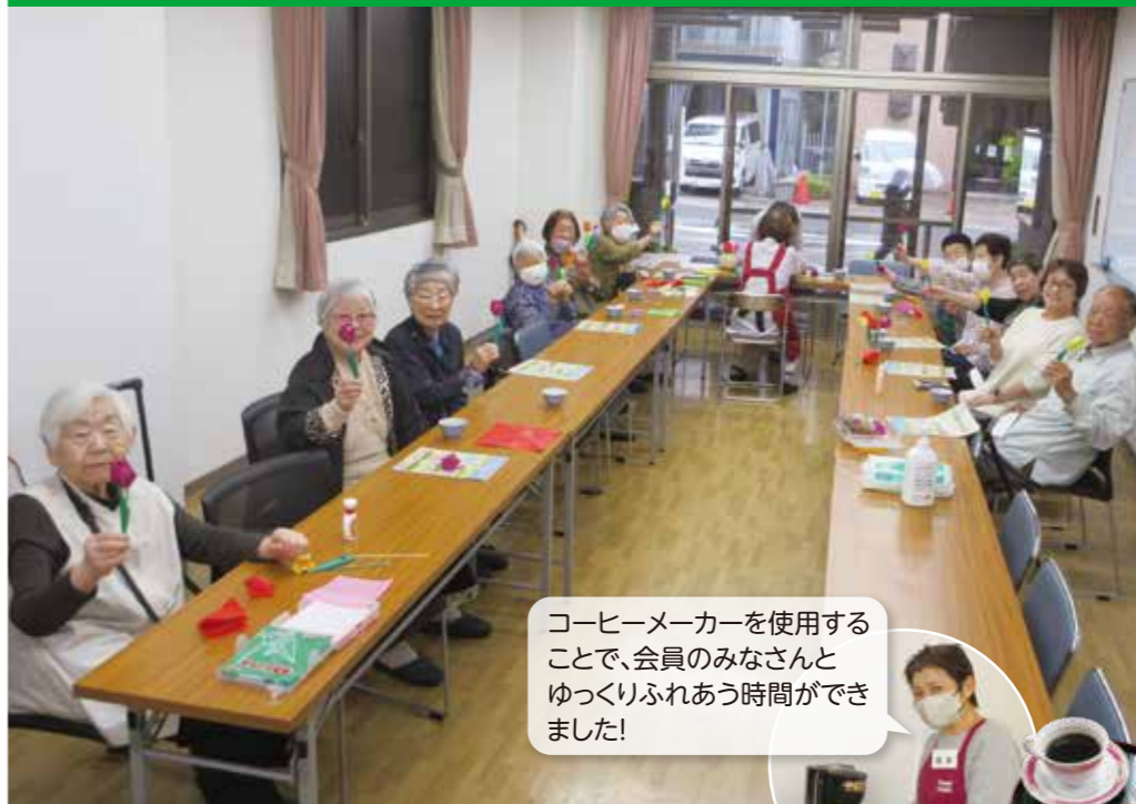
コーヒーマーカーを使用することで、会員のみなさんとゆっくりふれあう時間ができました!

活動日時: 毎月第2・第4月曜日 ※祝日の際は翌日(火) 午前11時より 場所: 大江会館