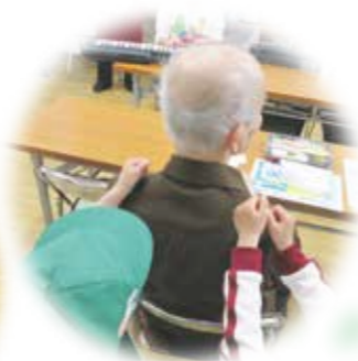
いつまでも元気でね

大江食事サービスでは、コロナ禍では見守りも兼ねて、できる限りの配食を試みたものの、感染症の広がりを受け、中断せざるを得なくなったそうです。その間も、顔を合わせる機会がなくなってきた利用者さんの体調が心配で、何とかしたい強い思いのもと、まず配食を再開され、その後念願の会食形式を復活されました。会食当初はお弁当を持ち帰る方も多かったのですが、食事前の折り紙体験や、大江幼稚園の園児との交流など、新しいイベントが□□に広がり、参加者の数も少しずつ増え始めています。中にはふれあい喫茶で噂を聞いた男性が、食事サービスにも参加されるようになり、楽しく歓談されている様子。ボランティアの皆さんの励みにもなっています。参加者同士の交流の場が自然と安否を確認できる場にもつながっています。