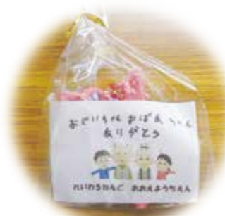
園児からの贈り物